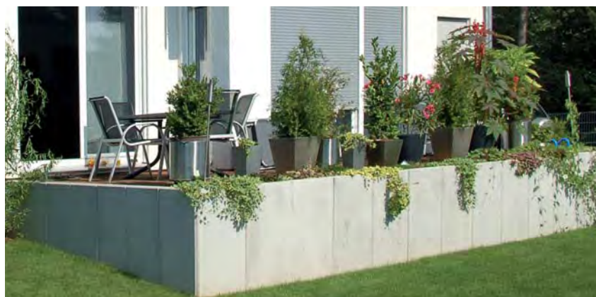
Winkelstützen, mit Armierung, grau Sichtbeton

Palisaden finden überall dort ihren Einsatz, wo etwas befestigt, abgegrenzt oder abgestützt werden soll. Beispiele sind Einfassungen von Pflasterflächen, Terrassierungen oder auch Treppenanlagen. L-Steine ohne Armierung eignen sich zum abfangen kleiner Böschungen oder anlegen von Hochbeeten. Statisch sind diese Betonelemente nicht für Verkehrs-lasten vorgesehen. Für diesen Zweck können Winkelstützen mit Armierung eingesetzt werden. Rasenmähkanten sind praktische Gestaltungselemente und werden als Abschluß einer Rasenfläche zum Zier- oder Nutzgarten verlegt.