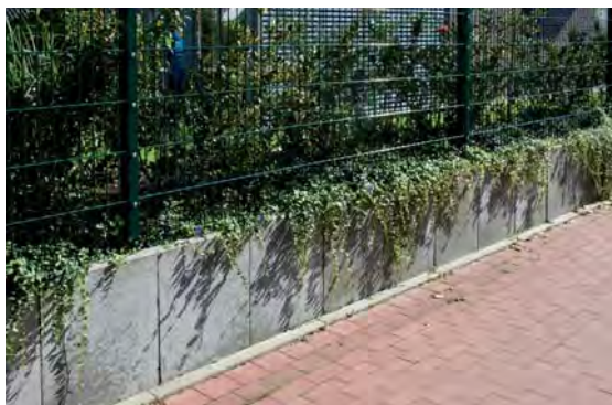
L-Stein, ohne Armierung, betongrau