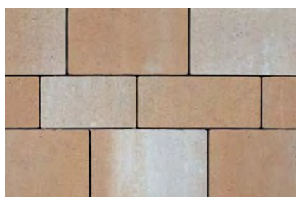
Bahnen-Kleinpflaster, sandsteinfarbig nuanciert