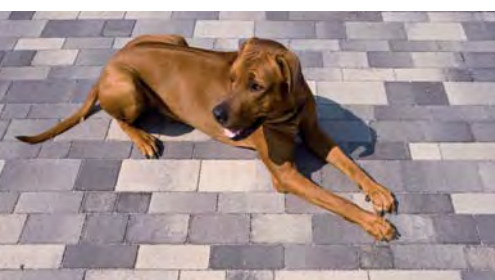
Bahnen-Kleinpflaster grau-schwarz nuanciert