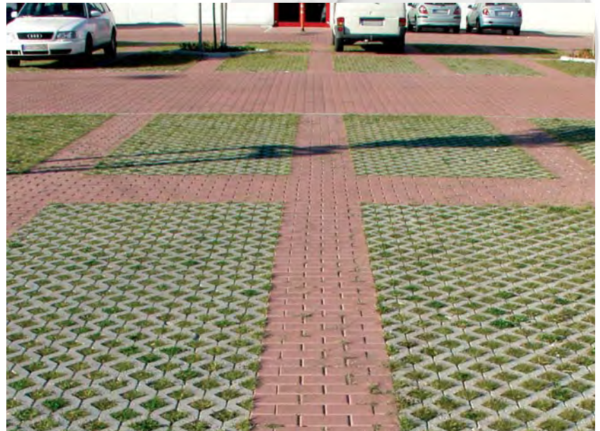
Stellflächen Rasengittersteine, Gehbereich Rechteckpflaster, Fahrwege I-Profil-Verbund