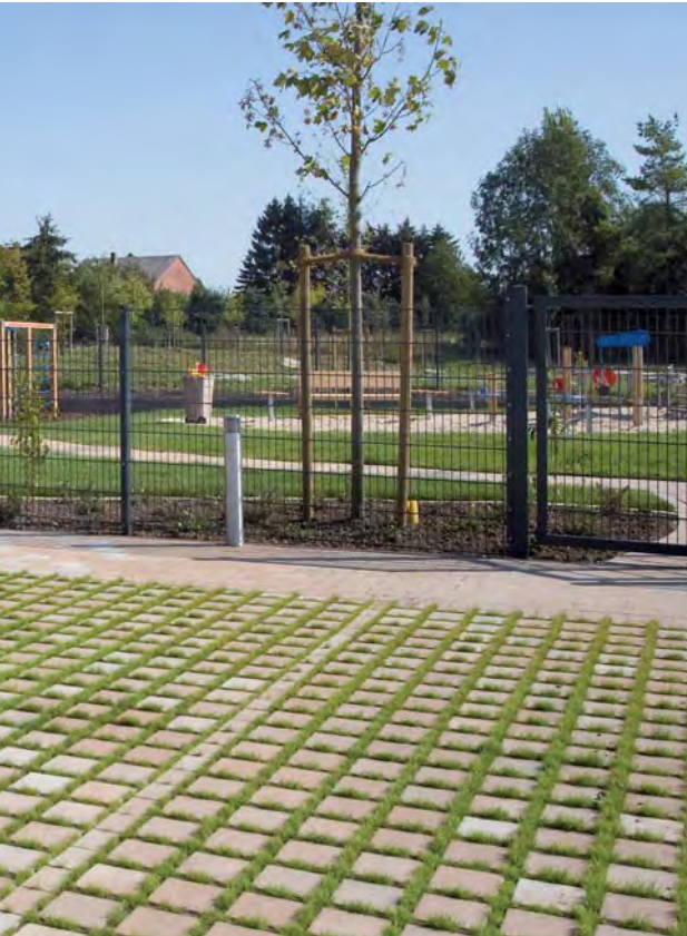
Ökopflaster 20x20 cm, sandsteinfarbig nuanciert