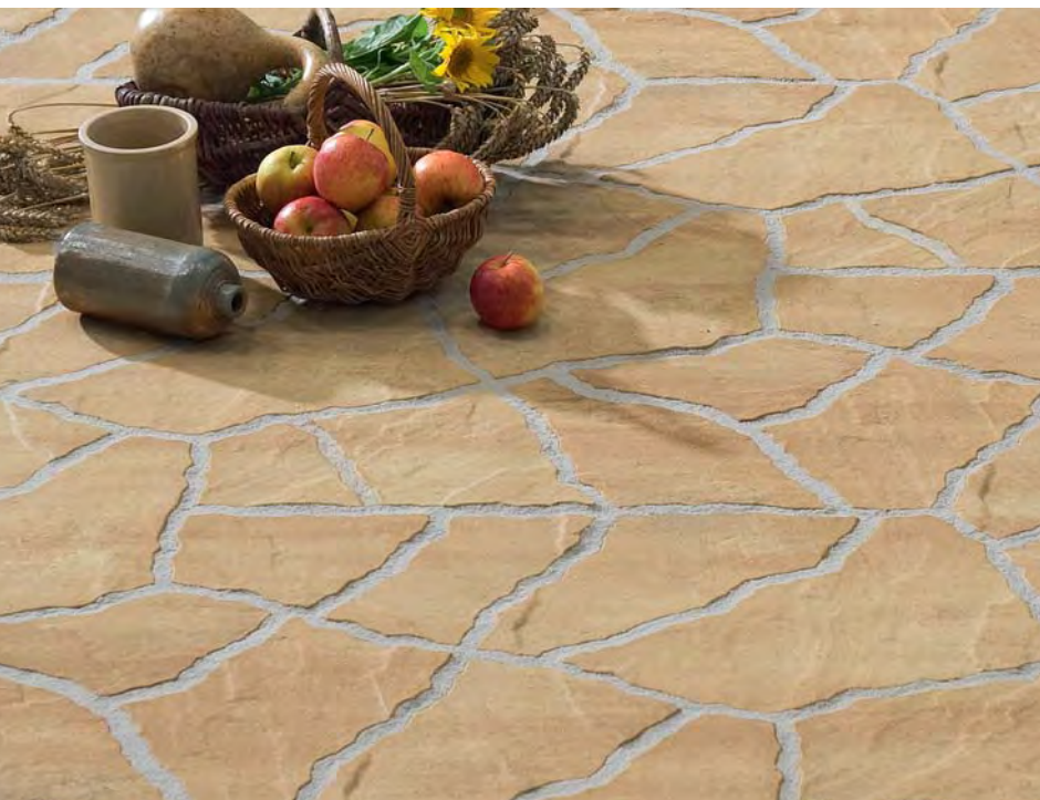
Tosca Pentagonalplatten, sandsteinbeige