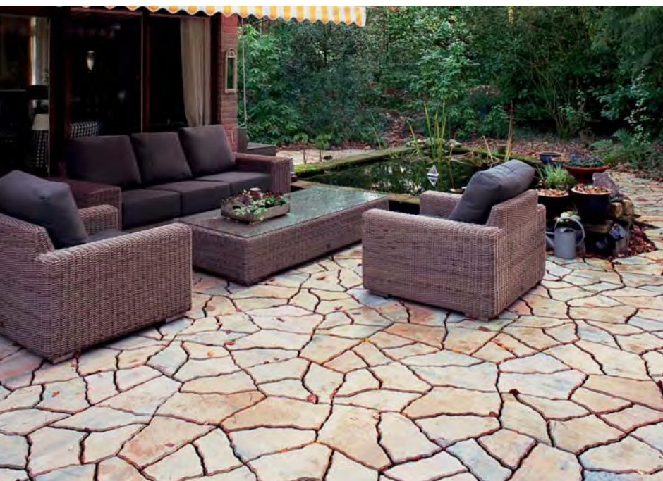
Tosca Pentagonalplatten, dolomit hell

In südlichen Ländern begegnen sie uns auf Schritt und Tritt – Polygonal und Pentagonalplatten aus Naturstein. Diese Steine waren Vorbild bei der Entwicklung der Tosca Pentagonalplatten. Das Steinsystem besteht aus vier verschiedenen Steinformaten, die jeweils durch Scheinfugen in ihrer Oberfläche eine naturnahe, dem Polygonalstein verwechselnd ähnliche Optik ergeben.