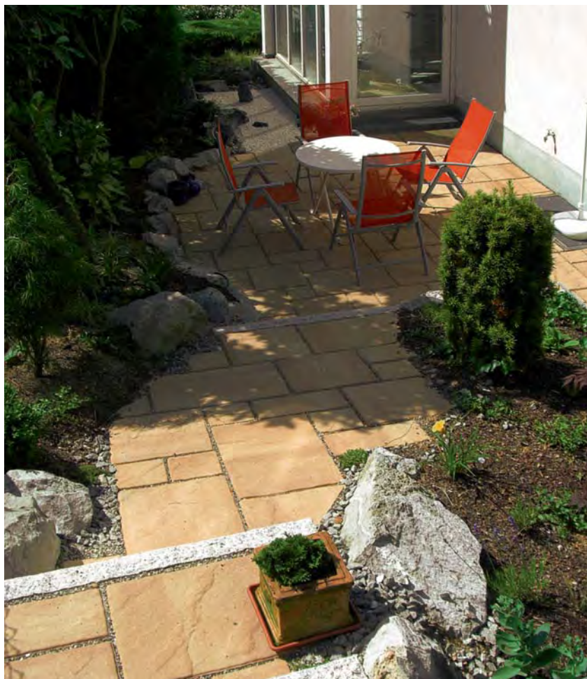
Tosca Terrassenplatten, sandsteinbeige