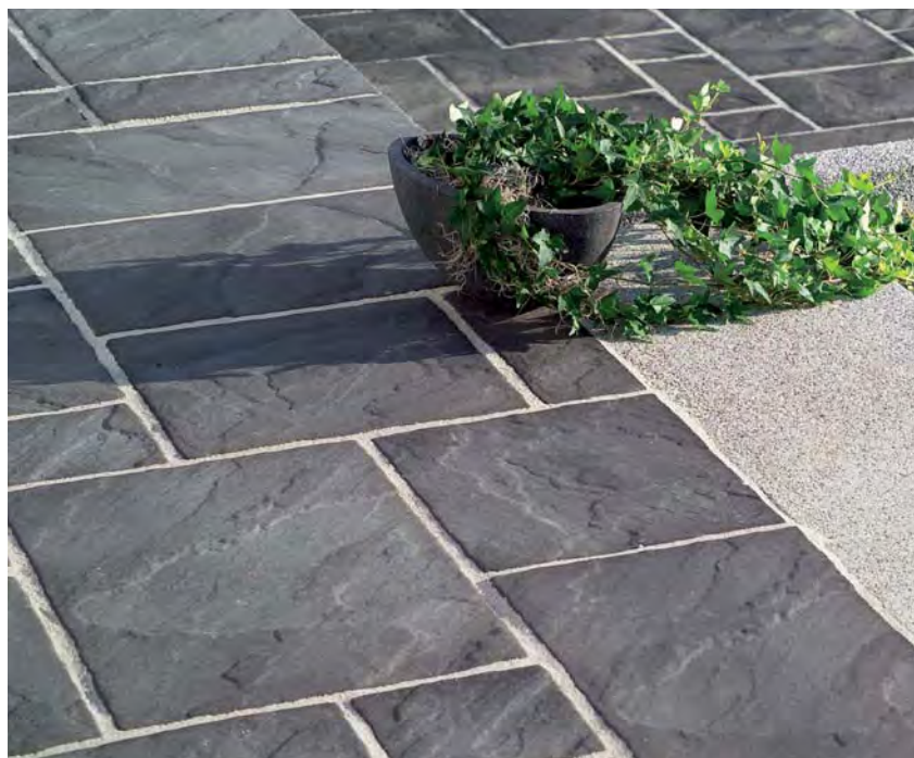
Tosca Terrassenplatten, schieferantik

Tosca Terrassenplatten, Tosca Pentagonalplatten und Noblesse Terrassenplatten sind mit einer Imprägnierung versehen, die eine üblicherweise vorhandene kapillare Saugfähigkeit von mineralischen Baustoffen minimiert. Die Oberflächen haben eine wasserabweisende Eigenschaft, wodurch gleichzeitig die Schmutzempfindlichkeit deutlich reduziert wird. Pflegehinweise finden Sie im technischen Teil des Kataloges.