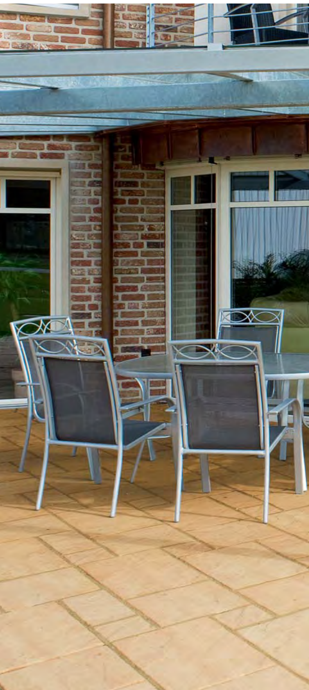
Tosca Terrassenplatten, sandsteinbeige