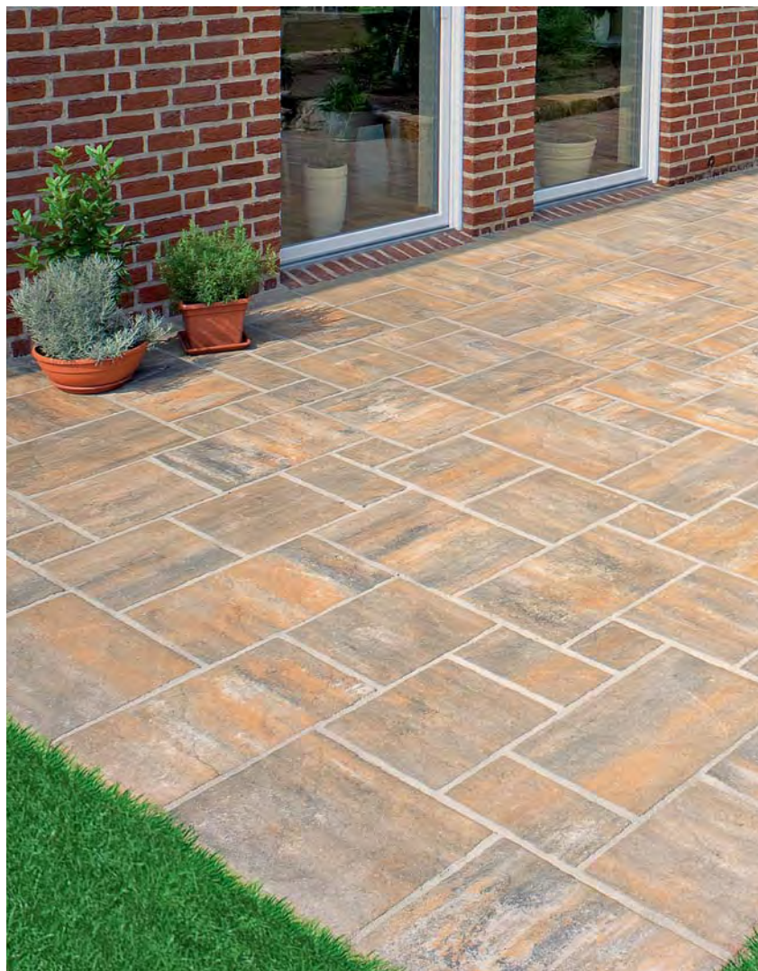
Tosca Terrassenplatten, muschelkalk

Tosca Terrassenplatten gefallen durch ihre natürliche Optik. Der exklusive Bodenbelag mit seiner feinen Oberflächenstruktur und den unregelmäßigen Kanten erzeugt ein zauberhaftes Ambiente. Keine Platte gleicht der anderen – wie bei von Hand bearbeitetem Naturstein. Tosca Terrassenplatten bestehen zum großen Teil aus Natursteinmaterialien, die unter strengen Qualitätskriterien mit modernster Fertigungstechnik hergestellt werden. Die maßlich aufeinander abgestimmten Plattenformate werden im Wildverband verlegt.